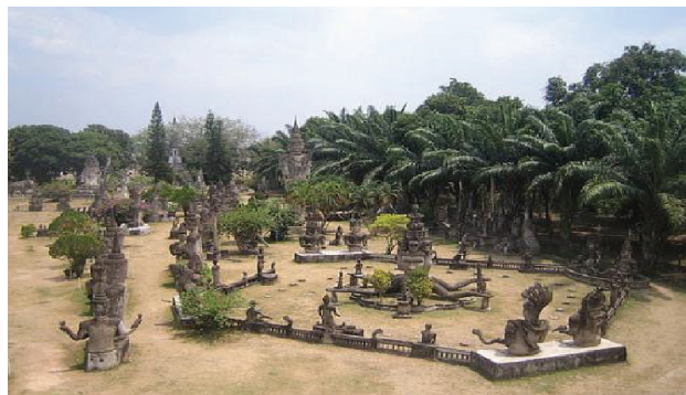
Vườn Tượng Phật - Buddha Park - Lào