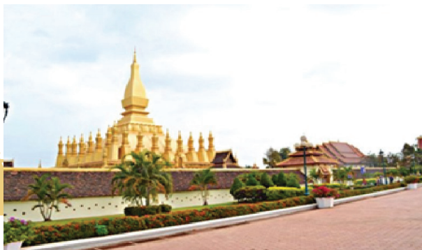
Chùa That Luang -Lào

Đại biểu, doanh nhân tham quan 1 số cảnh đẹp của Thủ đô Vientiane, Cộng hòa Dân chủ Nhân dân Lào và trải nghiệm mua sắm tuyệt vời tại tỉnh Udon Thani - Miền Bắc Vương quốc Thái Lan - Thủ phủ Cộng đồng người Việt Nam tại Thái Lan.