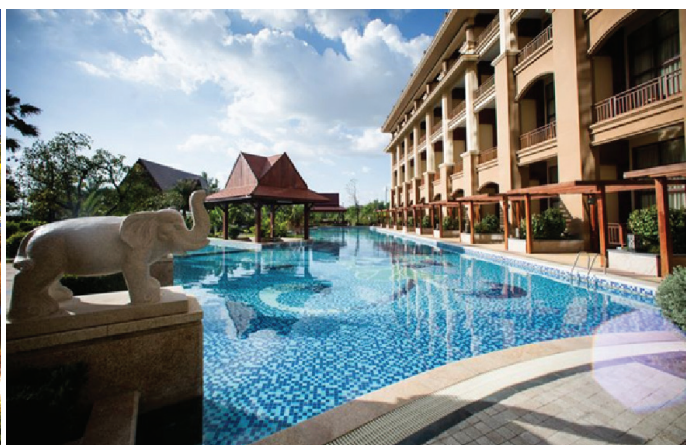
Khách sạn 5 sao Landmark Mekong Riverside – Thủ đô Vientiane, Lào