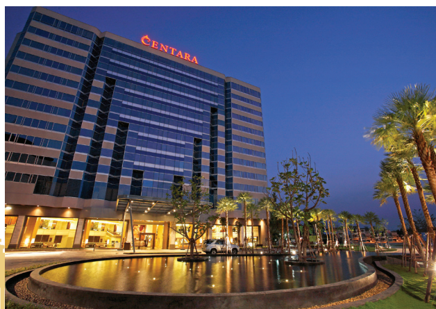
Centara Hotel & Convention Centre Udon Thani