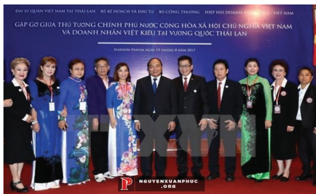
Thủ tướng Nguyễn Xuân Phúc gặp doanh nhân Việt Kiều tại Vương quốc Thái Lan

Cộng đồng doanh nhân Việt Kiều tại Thái Lan (đại diện là Hiệp hội Doanh nhân Thái - Việt Nam) kết nối hiệu quả hợp tác đầu tư góp phần quan trọng đem lại kết quả kinh doanh tốt đẹp cả về số lượng và sự đa dạng trong sản xuất kinh doanh và thương mại-du lịch cho cả hai nước.